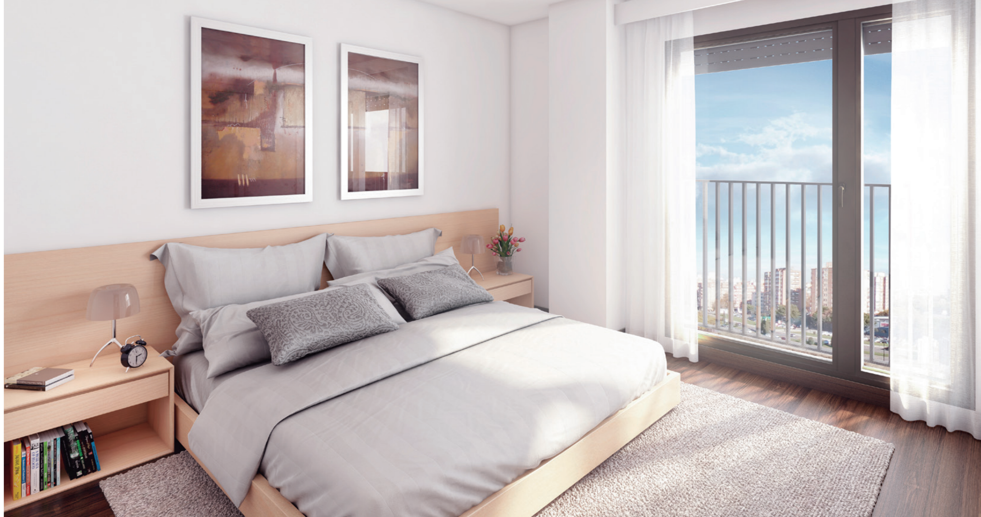
Foto / Habitación principal

Además, podrás apreciar la gran luminosidad de las estancias y sus acabados de alta calidad