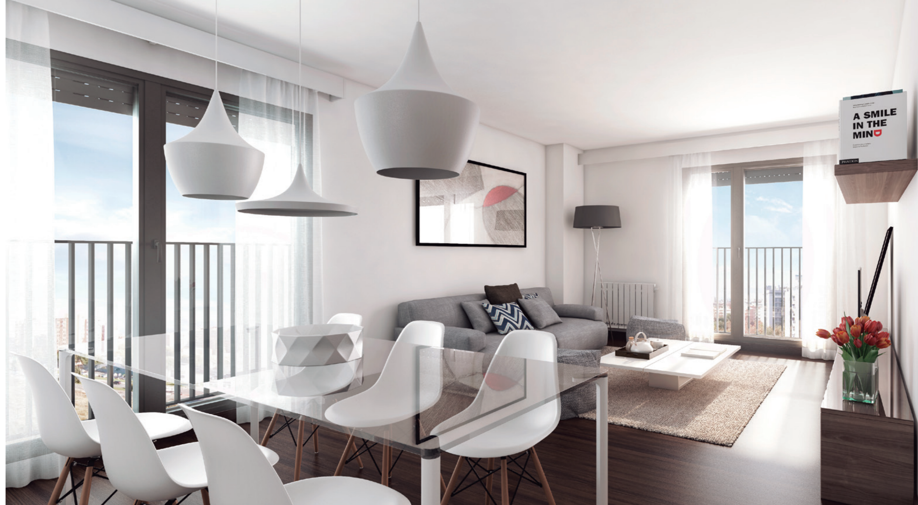
Foto / Interior Salón

Una plaza de aparcamiento y trastero por vivienda.