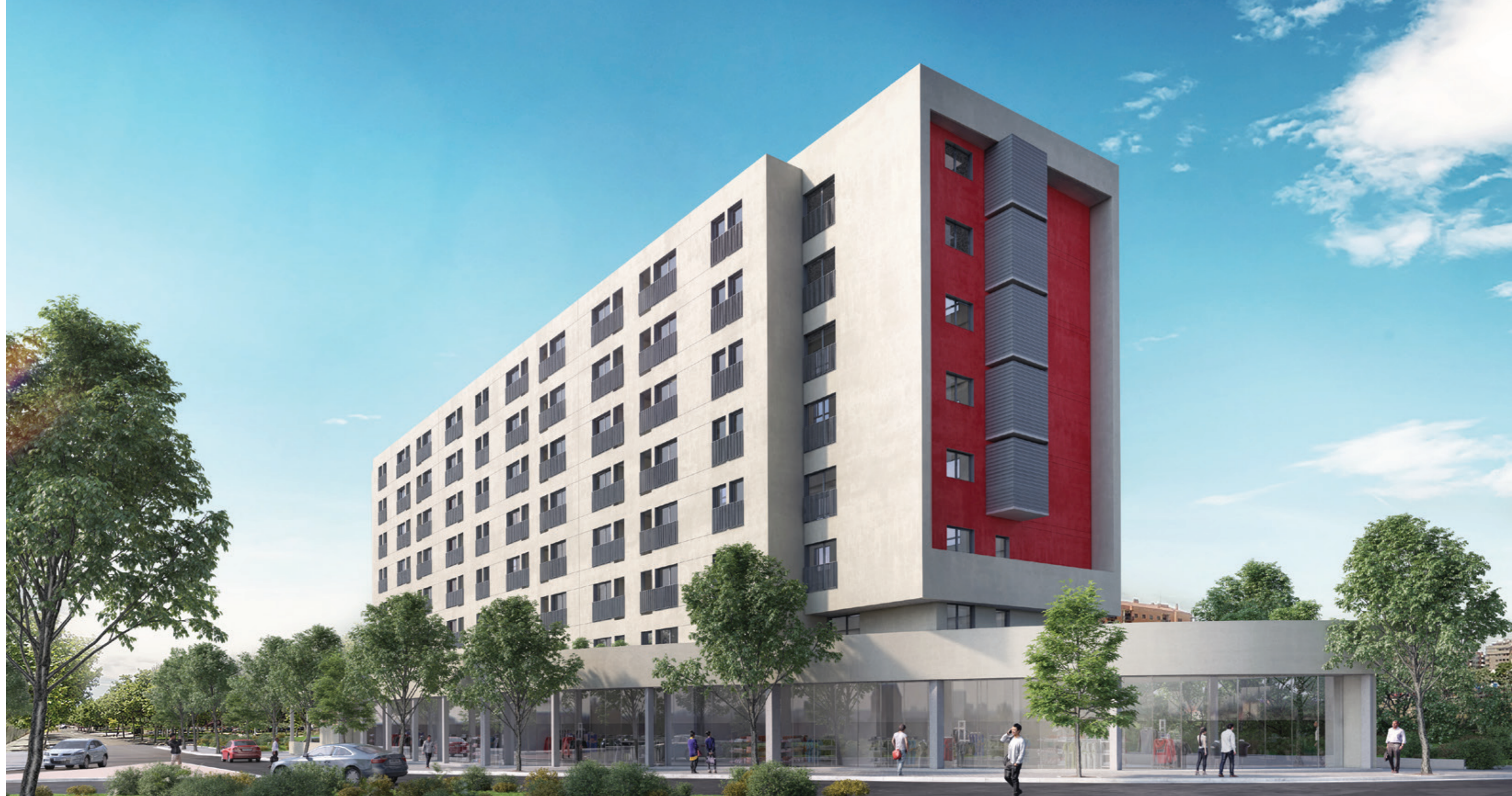
Foto / Fachada Maqués de la Cadena

Cercana a colegios e institutos, centros de salud, farmacias y entidades financieras