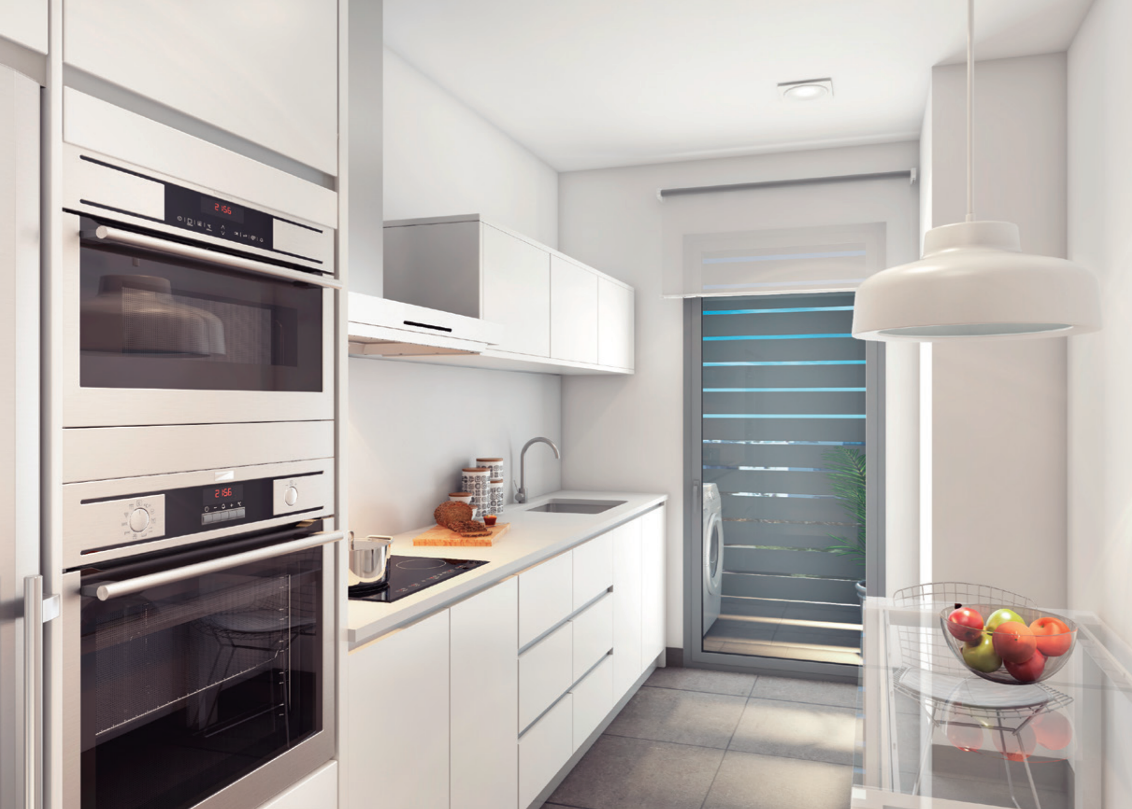
Izquierda / Cocina