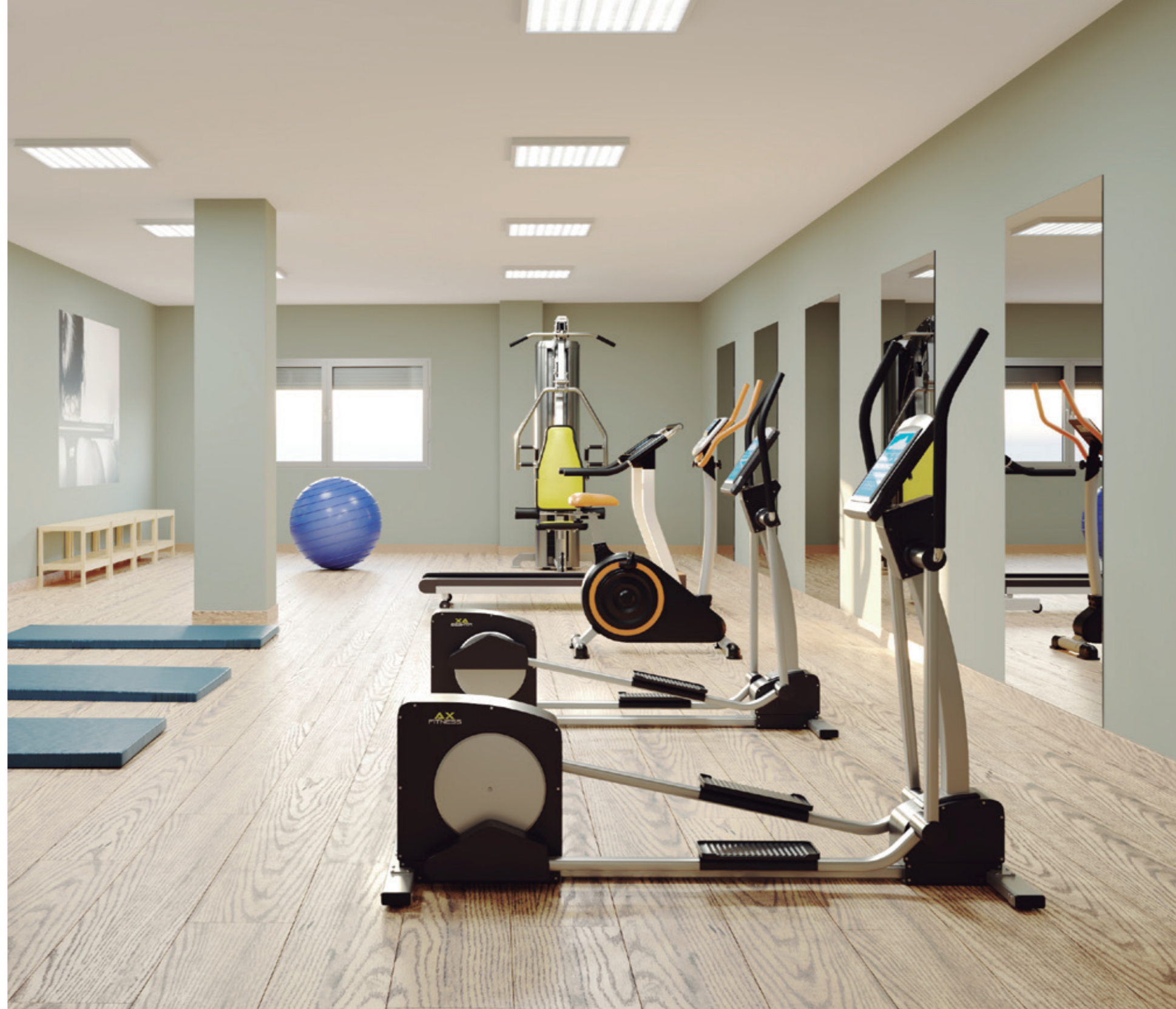
Office zona común