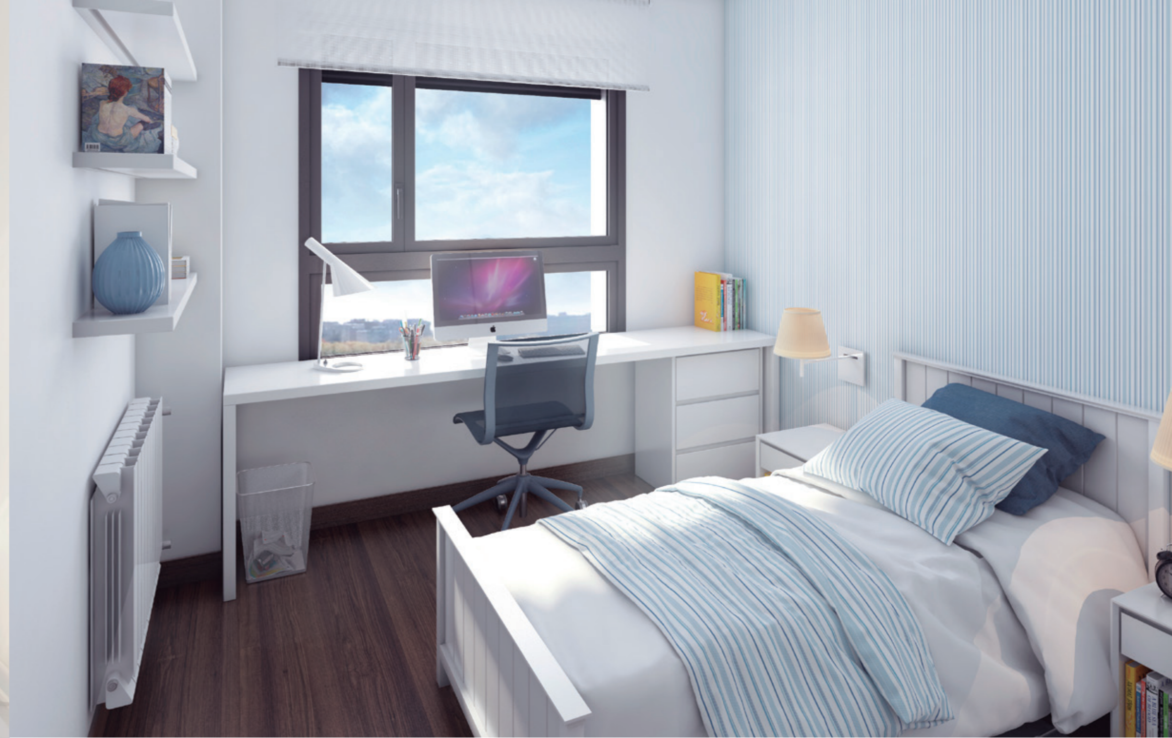
Derecha / Habitación secundaria